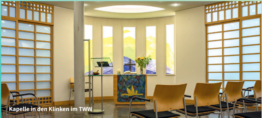
Kapelle in den Kliniken im TWW